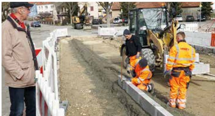
Bauen unter kritischen Blicken: dieser Herr war vor langer Zeit an der Engener Grundschule einmal Hausmeister.