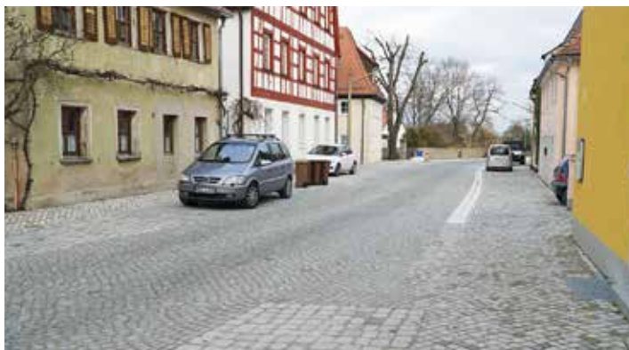
Verkehrsraum, den man sich teilen muss. Das Pflaster in verschiedenen Formen und Farben hilft.