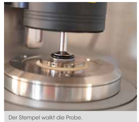
Der Stempel walzt die Probe.

Hauke erläutert das neue Gerät: „Mit dem Verformungsverhalten fließfähiger Materialien – zu denen auch Bitumen gehört – beschäftigt sich die Rheologie. Das DSR misst das Verformungsverhalten bei ansteigenden Temperaturen über den komplexen Schermodul und den Phasenwinkel. Oder vereinfacht ausgedrückt: Die Bitumenprobe liegt dabei auf einer beheizten Bodenplatte, wird von einem Stempel sozusagen gewalzt und das Gerät ermittelt die Scherkräfte. Daher der Name des Gerätes: Dynamisches Scherrheometer.“