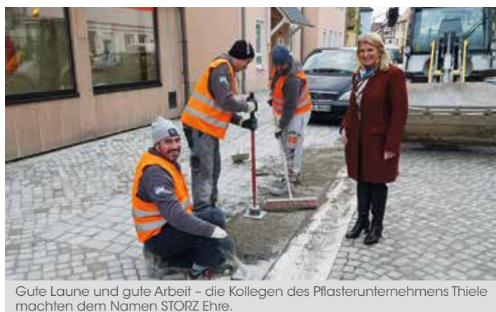
Gute Laune und gute Arbeit – die Kollegen des Pflasterunternehmens Thiele machten dem Namen STORZ Ehre.