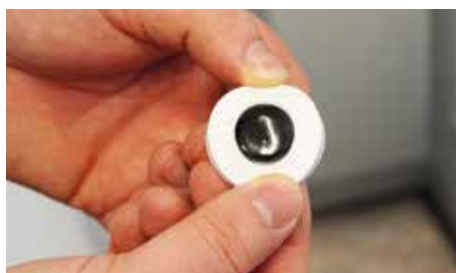
Eine kleine Bitumenprobe, wie sie auf die beheizte Bodenplatte des DSR gelegt wird.