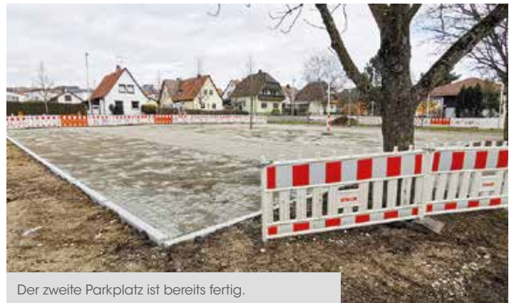
Der zweite Parkplatz ist bereits fertig.