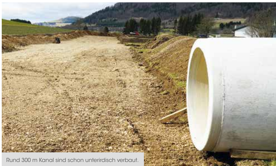
Rund 300 m Kanal sind schon unterirdisch verbaut.