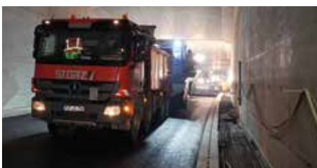
Im Tunnel sind LKW mit Schiebetechnik nötig.

Es dröhnt, es ist laut, es ist heiß. Eine Woche lang. Asphalteinbau im Tunnel Waggerhausen – Arbeit unter besonderen Bedingungen.