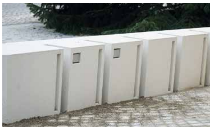
Dieses hat es in sich: Steckdosen zum Laden von E-Bikes.