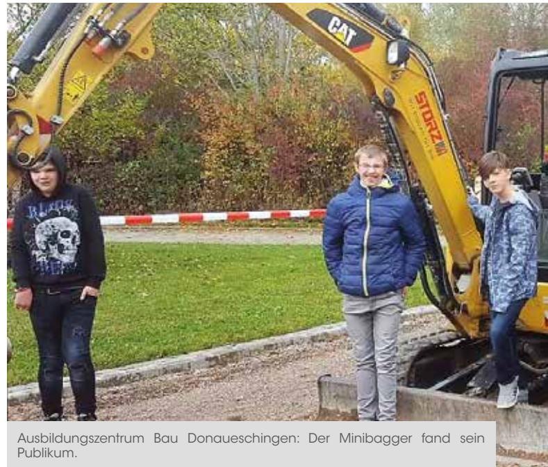
Ausbildungszentrum Bau Donaueschingen: Der Minibagger fand sein Publikum.