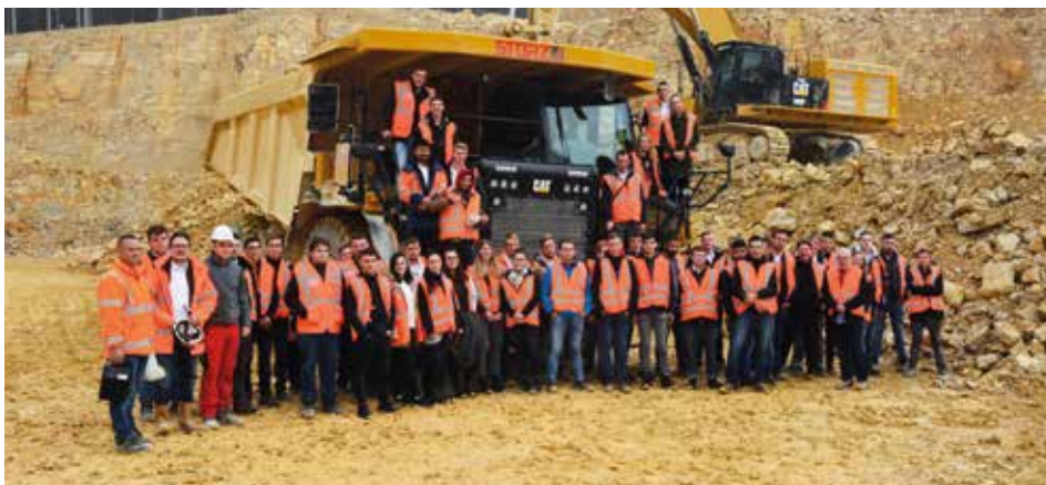
Im Schotterwerk Neuhausen konnten die STORZ-Azubis die Baustoffproduktion kennenlernen.