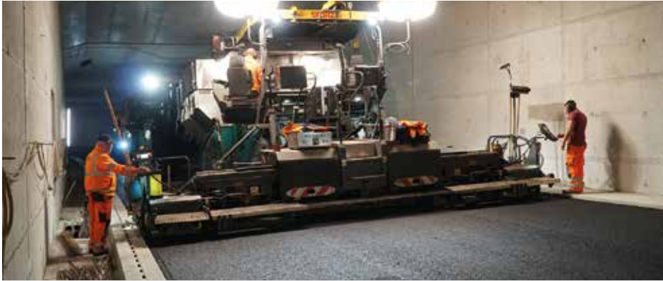
Präzisionsarbeit unter schwierigen Bedingungen: Asphalteinbau im Tunnel Waggerhausen.