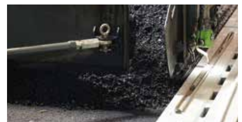
Millimeterarbeit am Fertiger.