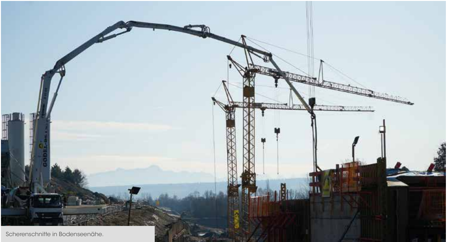
Scherenschnitte in Bodenseenähe.