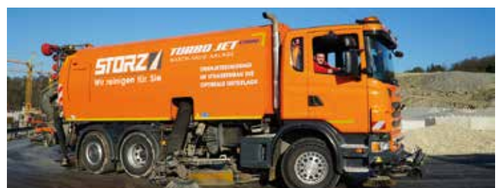
STORZ – wir reinigen für Sie!