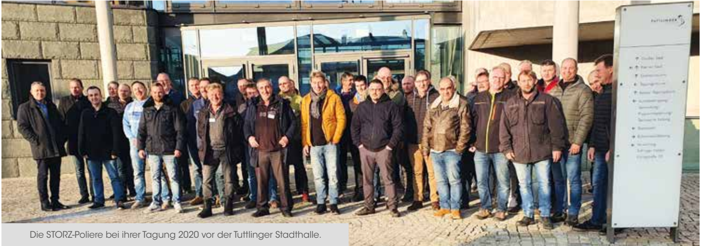
Die STORZ-Poliere bei ihrer Tagung 2020 vor der Tuttlinger Stadthalle.

Winterzeit ist Tagungszeit. Auch wenn dieser Winter mal wieder seinen Namen kaum verdient, eher die Plus- als die Minus-Temperaturen dominierten und bereits viele Baustellen wieder auf ordentlichen Touren liefen. Zu Beginn des Jahres hieß es trotzdem für Facharbeiter, Poliere und Ingenieure, zurückzublicken und Bilanz zu ziehen, Erfahrungen auszutauschen und vor allem Neues zu erfahren. So auch auf der Poliertagung 2020, die wie immer in der Tuttlinger Stadthalle stattfand.