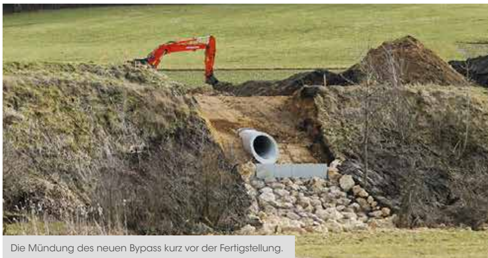
Die Mündung des neuen Bypass kurz vor der Fertigstellung.

Wenn es um Bypass-Operationen geht, ist Mundschutz Pflicht – wie bei allen anderen chirurgischen Eingriffen auch. In Immendingen westlichem Ortsteil Hintschingen haben Storzianer allerdings ohne dieses derzeit begehrte medizinische Hilfsmittel einen Bypass gelegt, dafür aber mit schwerem Gerät. Ein vorbeugender Einsatz zu Rettungszwecken. Gefährdet waren bislang weniger Menschenleben, dafür aber Hab und Gut. Denn durch Hintschingen fließt der Talgraben, ein Dorfbach, vom Wasser der umliegenden Höhen gespeist. Eigentlich fließt er weitgehend unter dem Dorf durch, denn er ist seit langem verdolt.